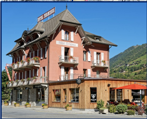
Hôtel Terminus, Orsières