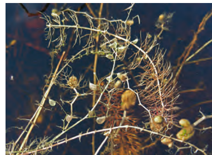
Abb. 10 (oben): Utricularia bremsii wurde in der Drumlinlandschaft 2012 und 2015 im Blühzustand in einem alten, mesotrophen Torfstich nachgewiesen. Teilgebiet A, 14. 7. 2015.