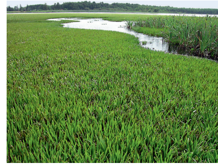
Abb. 1: Krebsscherenbestand im Uferbereich eines Sees in Ostpolen. Die Bestände bilden dichte Teppiche aus, in denen praktisch keine andere Pflanzenart wächst.

Das Verbreitungsareal der Grünen Mosaikjungfer erstreckt sich von den Niederlanden über Norddeutschland und Südschweden bis Westsibirien. In Süd- und Mitteldeutschland oder auch in der Schweiz kommt die Art nicht vor (DIJKSTRA & LEWINGTON 2006).