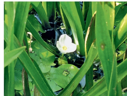
Abb. 2: Detail aus einem Bestand der Krebsschere ( Stratiotes aloides ). Zwischen den Rosetten sind Schwimmblätter und eine Blüte des Froschbisses ( Hydrocharis morsus-ranae ) sowie Wasserlinsen ( Lemna sp.) zu sehen.