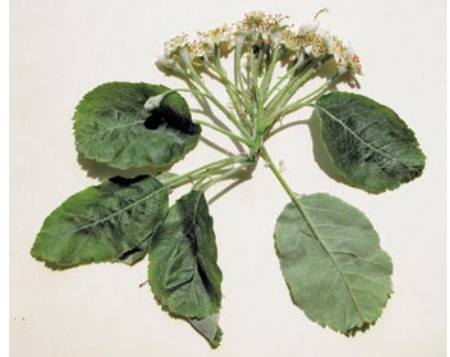
Fig. 3: Inflorescence de Sorbopyrus auricularis (M. Hoff 8207)