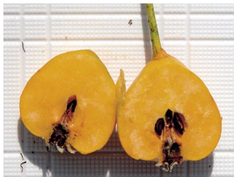
Fig. 5: Coupe du fruit

jaune-orangé, douce et sucrée, peu parfumée, à odeur douceâtre et à consistance de pomme farineuse (parfois à saveur de coing), pépins non fertiles. Fleur: avril à mai; fruit: mi-août à octobre.