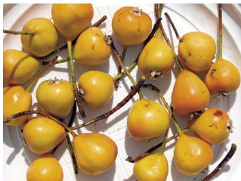
Fig. 4: Les «poires de Bollwiller», fruits du Sorbopyrus auricularis