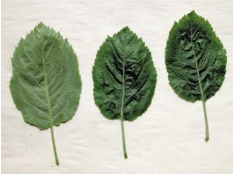
Fig. 2: Feuilles de Sorbopyrus auricularis (M. Hoff 8207)