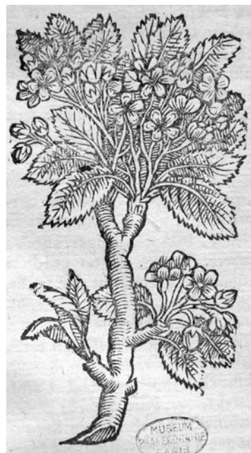
Fig. 1: Gravure de Pirus polvilleriana J. Bauhin, 1650

Ouvrage du Laboratoire de Phanérogamie du Muséum national d'Histoire naturelle, Paris