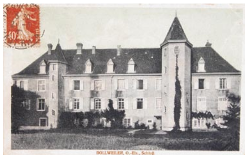
Fig. 7: Le Château Rosen de Bollwiller au début du 20 ème siècle