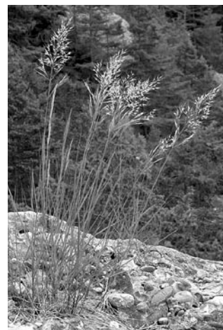
Abb. 3: Das Rauhgras ( Achnatherum calamagrostis ) ist ein typischer Besiedler der besonnten feinerdearmen Blockoberflächen.