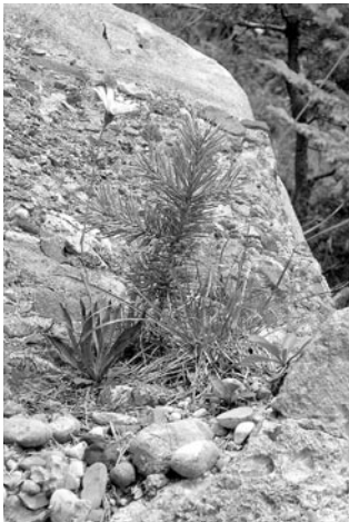
Abb. 2: Typische Kleinlebensgemeinschaft auf einem Block mit Jungföhre, Hasenohr-Habichtskraut ( Hieracium bupleuroides ) und Horstsegge ( Carex sempervirens ).

Carex sempervirens Sesleria coerulea Achnatherum calamagrostis Calamagrostis varia Hieracium bupleuroides Thymus polytrichus Polygala chamaebuxus Tortella tortuosa Schistidium apocarpum