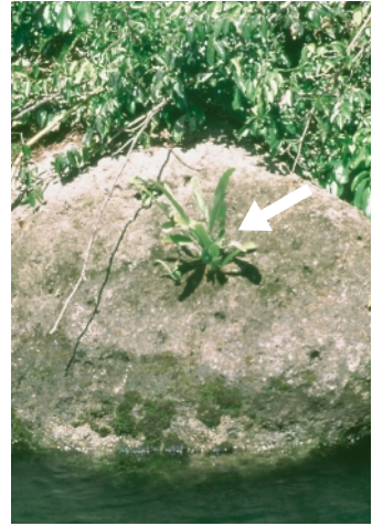
Abb. 1: Epiphytisch und lithophytisch wachsendes Niphidium (Polypodium) crassifolium im Tiefland Panamas. Das linke Bild zeigt den Farn auf Ceiba pentandra in 35 m Höhe, das rechte dieselbe Art auf einem Felsblock am Panamakanal. Allerdings ist ein lithophytisches Vorkommen bei dieser Art nur sehr selten zu beobachten.

Musters wie z. B. Neuseeland (OLIVER 1930, DAWSON & SNEDDON 1969) oder der südliche Himalaja (DUDGEON 1923, VERMA & KHULLAR 1980, GURUNG 1985) mit jeweils recht artenreichen Gefäseepiphytenfloren. Die Zusammensetzung der Epiphytengemeinschaften in temperaten Wäldern ändert sich jedoch auch in diesen Gebieten qualitativ gegenüber den Tropen, wie z. B. HOFSTEDE et al. (2001) für einen neuseeländischen Nothofagus -Regenwald zeigen. So fanden sich zwar durchaus mit tropischen Regenwäldern vergleichbare Artenzahlen, aber 41 der 55 epiphytisch wachsenden Taxa waren fakultative Epiphyten, nur 14 Arten waren obligat epiphytisch. In anderen temperaten Gebieten ist der Anteil «echter» Epiphyten an den auf Bäumen wachsenden Gefässpflanzen noch geringer (BÉGUINOT A & TRAVERSO 1905, OCHSNER 1928, BROWN 1948, KOLBECK 1995, ZOTZ 2002, vgl. auch RUNDEL & DILLON 1998). Auch dies hat SCHIMPER (1888) bereits angedeutet, mutmasste er doch, dass im südlichen Himalaja wohl die meisten, wenn nicht alle Epiphyten fakultativ seien.