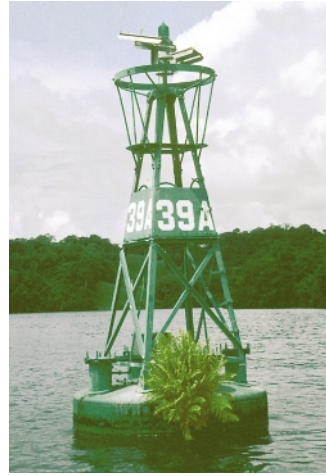
Abb. 3: «Epiphytischer» Farn auf einer Boje im Panamakanal

und generativer Merkmale anführen, die den meisten Holoepiphyten eigen sind (z. B. relativ kleine Samen und zumindest eine gewisse Trockenheitsresistenz, BENZING 1990), aber es gibt einerseits viele Epiphyten ohne offensichtliche Anpassungen (BARKMAN 1958), und andererseits haben auch viele rein terrestrische Pflanzen die eben genannten Eigenschaften. Nach SCHIMPER (1888) haben sich echte Epiphyten so stark an das Leben in den Bäumen angepasst, dass ihnen ein terrestrisches Leben nicht mehr möglich ist. Abgesehen davon, dass viele Epiphyten sehr wohl auch auf anderem Substrat leben können (Abb. 1–3, siehe auch PETT-RIDGE & SILVER 2002) oder auf verschiedensten Substraten kultiviert werden können, ist die Art der vermuteten «Anpassung» in vielen Fällen aber nicht klar.