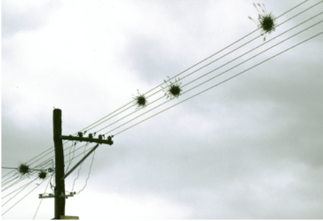
Abb. 2: «Epiphytische» Tillandsien auf einer Stromleitung nahe Salta (Argentinien)