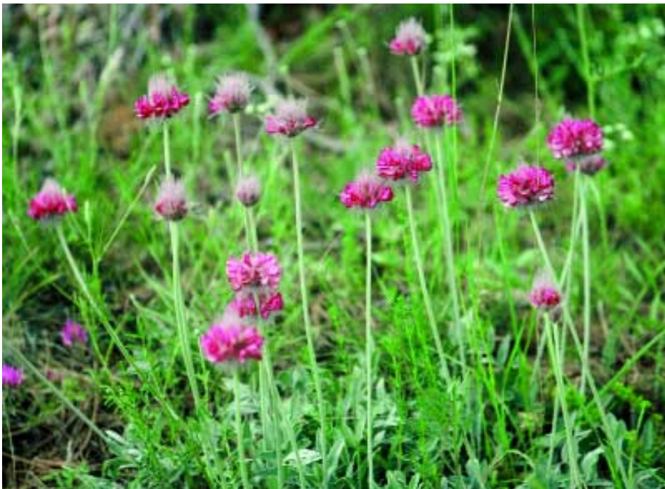
Abb. 7: Ebenus longipes Boiss. & Bal. in Boiss.