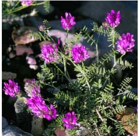
Abb. 11: Astragalus cancellatus Bunge