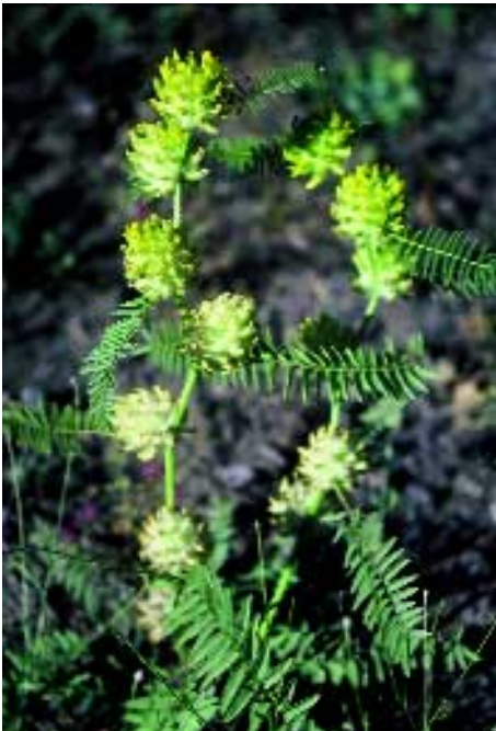
Abb. 16: Astragalus panduratus Bunge