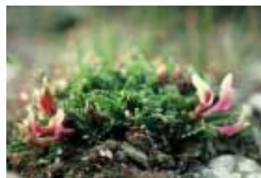
Astragalus brevidentatus Podlech