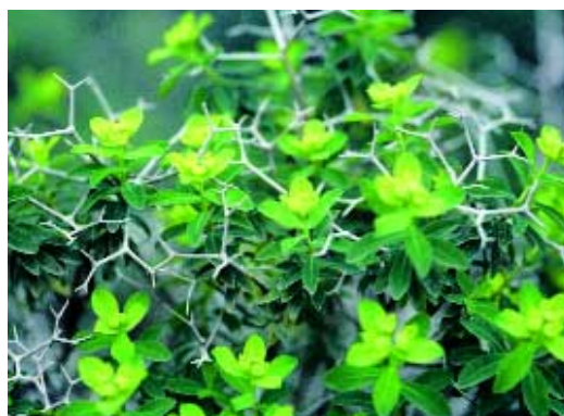
Abb. 6: Euphorbia austroanatolica Hub.-Mor. & M.S. Khan