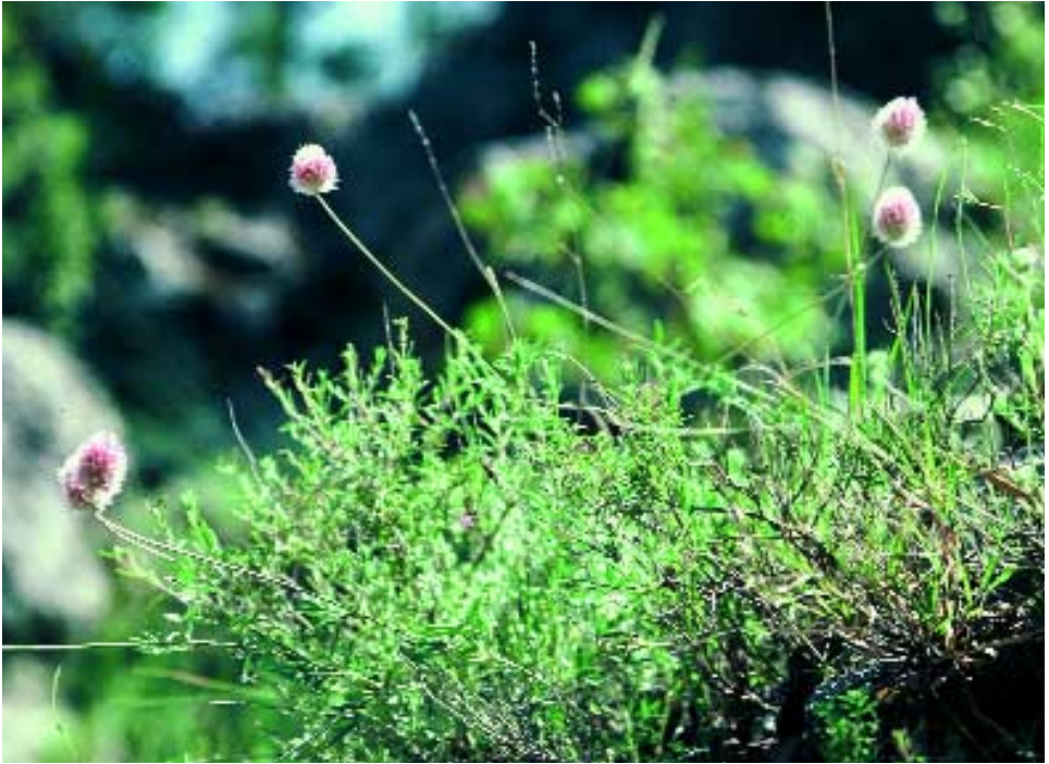
Abb. 9: Ebenus reesei Hub.-Mor. var. reesei