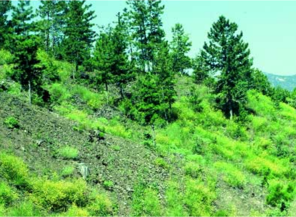
Abb. 12: Föhrenbestand mit Gonocytisus dirmilensis Hub.-Mor.