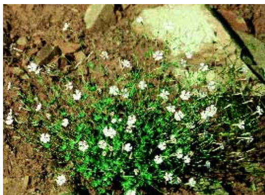
Abb. 5: Silene cariensis Boiss.