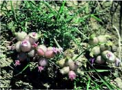
Abb. 14: Astragalus lineatus Lam. var. jildisianus (Bornm.) Matthews