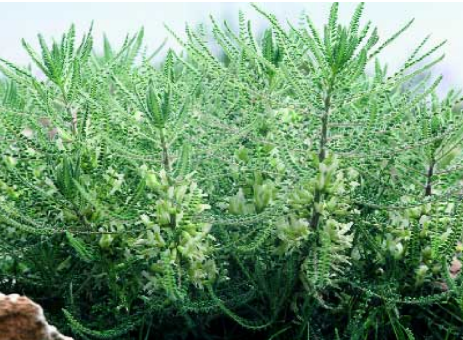
Abb. 13: Astragalus huber-morathii Agerer-Kirchhoff