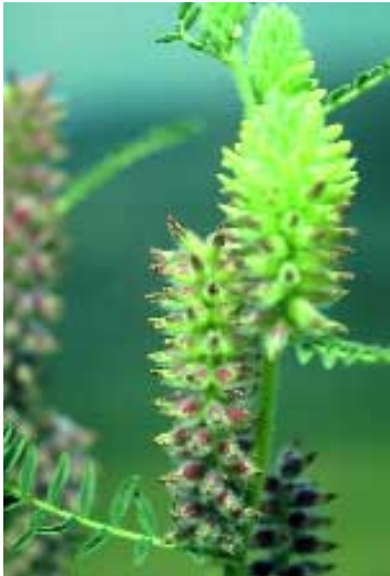
Abb. 10: Astragalus crinitus Boiss.