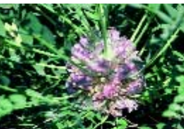
Astragalus dipodurus Bunge