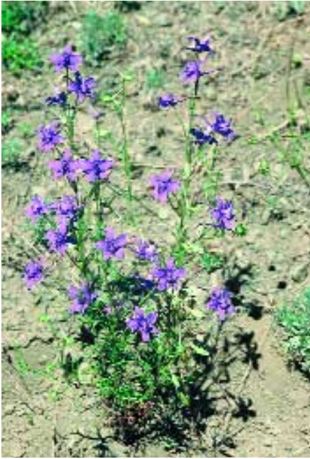
Abb. 1: Consolida armeniaca (Stapf ex Huth) Schröd.