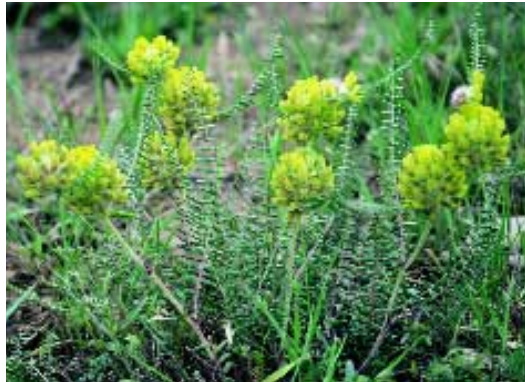
Abb. 15: Astragalus melitenensis Boiss.