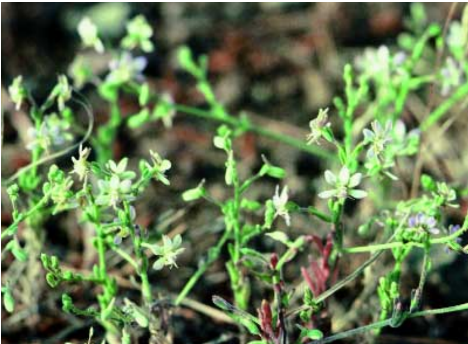
Abb. 3: Consolida lineolata Hub.-Mor. & Simon