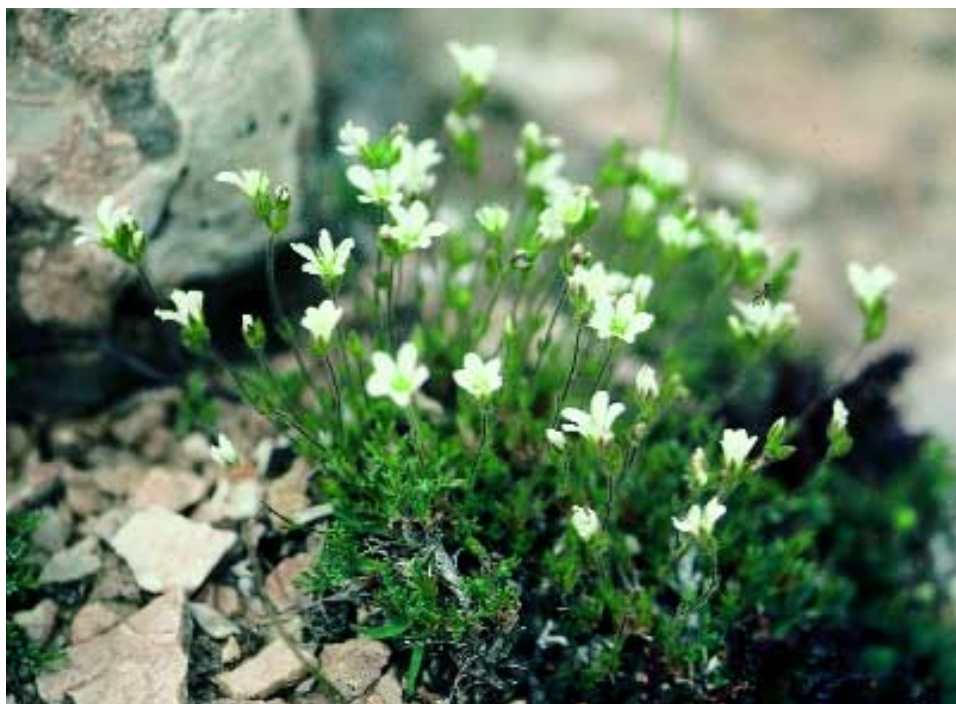
Abb. 4: Minuartia rimarum (Boiss. & Bal.) Mattf. var. multiflora