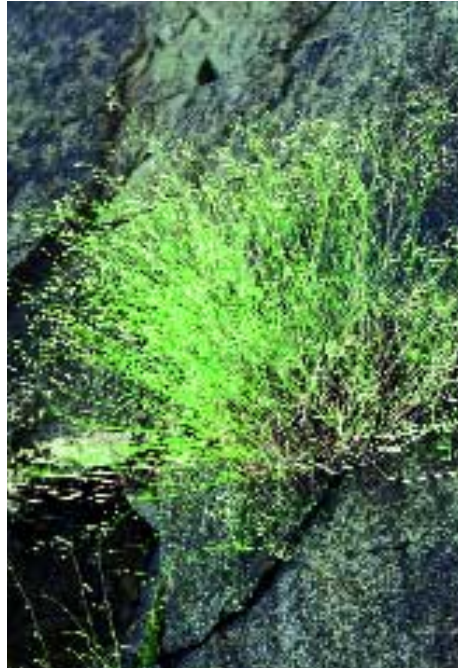
Abb. 2: Gypsophila tuberculosa Hub.-Mor.