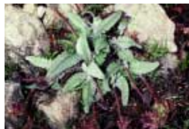
Astragalus oxytropifolius Boiss.