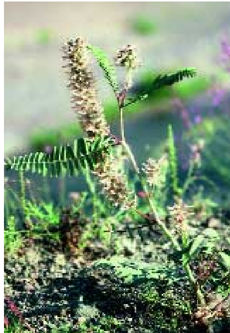
Abb. 17: Astragalus trichocalyx Trautv.