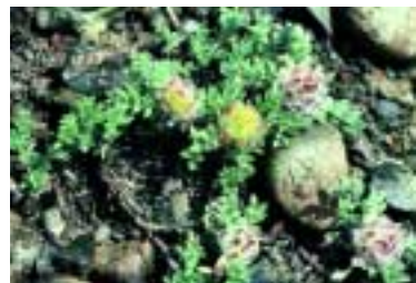
Astragalus pelliger Fenzl