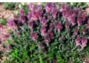
Astragalus hirticalyx Boiss. & Kotschy