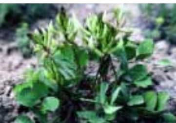
Astragalus paradoxus Bunge