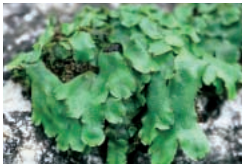
Abb. 4: Conocephalum conicum , dominierend auf dem Boden der Doline