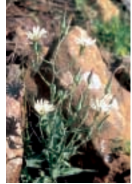
Steptorhampus tuberosus (Jacq.) Grossh.