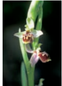
Ophrys bornmuelleri M. Schulze ssp. bornmuelleri