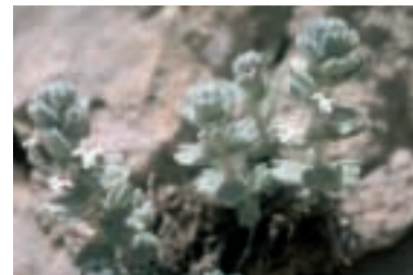
Ajuga vestita Boiss.