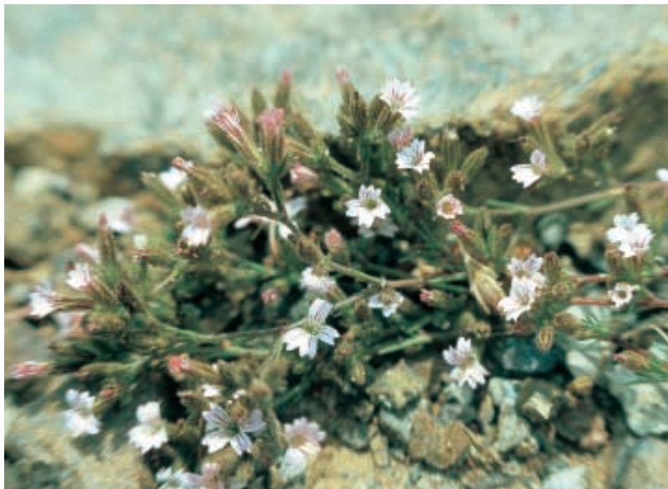
Abb. 3: Bolanthus huber-morathii Simon