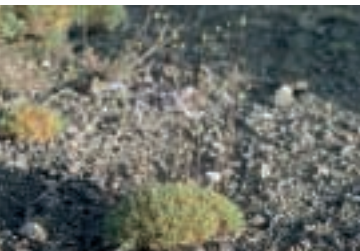
Arenaria pseudacantholimon Bornm.