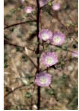
Althaea cannabina L.