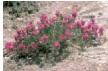
Hedysarum pestalozzae Boiss.