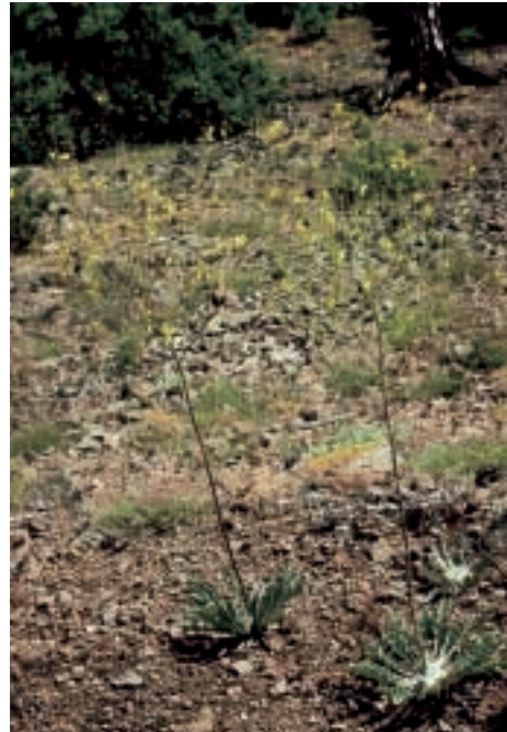
Abb. 24: Verbascum basivelatum Hub.-Mor.

Die Publikation dieses Artikels wurde möglich durch einen Beitrag an die Kosten für Satz und Druck durch die Freiwillige Akademische Gesellschaft, Basel.