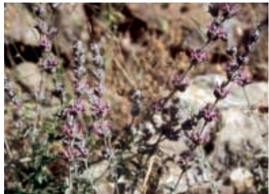
Abb. 10: Sideritis rubriflora Hub.-Mor.