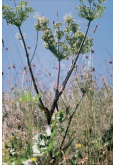
Abb. 14: Heracleum trachyloma Fisch. & Mey.