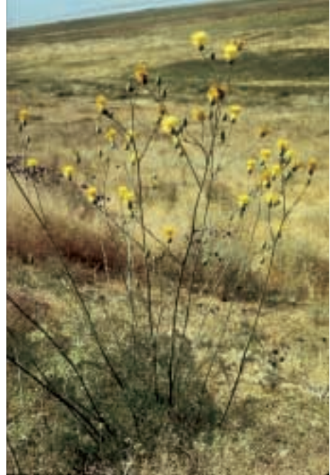
Abb. 20: Centaurea iconiensis Hub.-Mor.