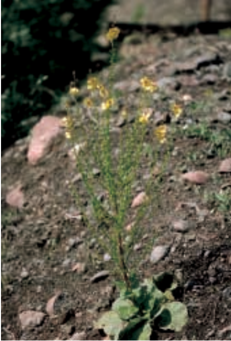
Abb. 21: Verbascum adenocaulon Boiss. & Bal.