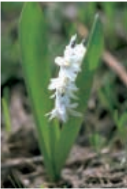
Puschkinia scilloides Adams