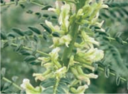
Abb. 7: Astragalus columnaris Boiss.