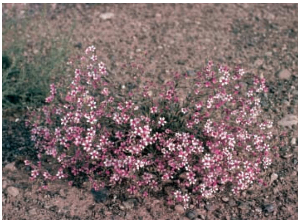
Abb. 4: Allochrysa bungei Boiss.