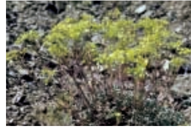
Alyssum virgatum Nyar.