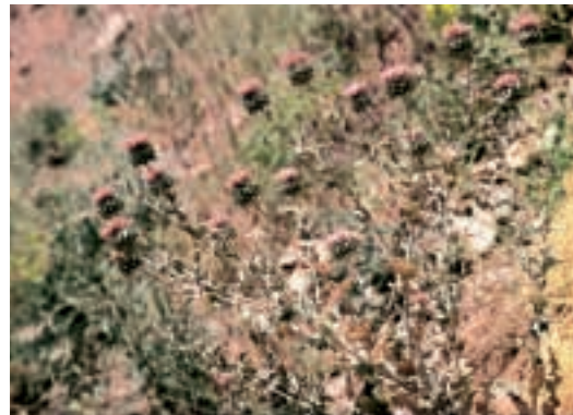
Abb. 16: Cousinia vanensis Hub.-Mor.