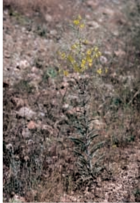
Abb. 22: Verbascum alepense Benth.