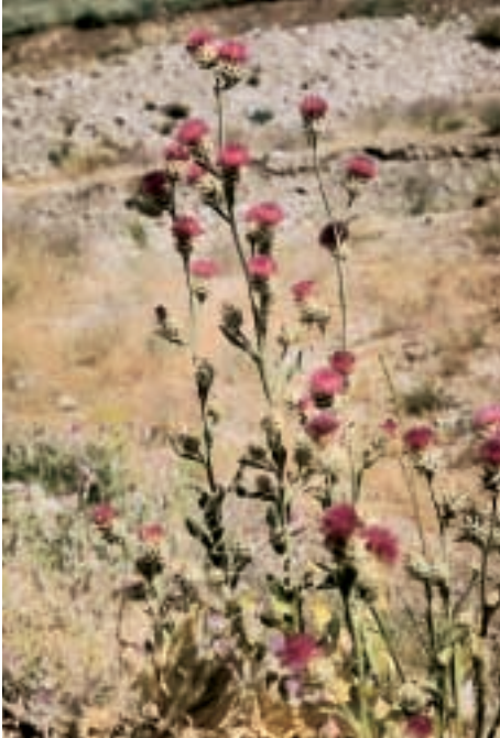
Abb. 19: Centaurea gigantea Schultz Bip.