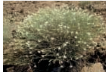
Dianthus crinitus Sm. var. crinitus