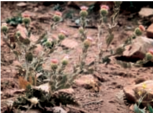
Abb. 15: Cousinia grandis C. A. Meyer