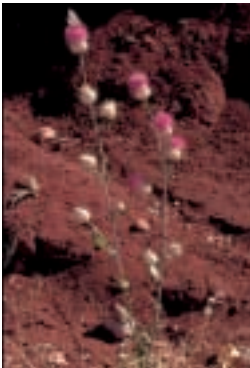
Centaurea tomentella Hand.-Mazz.