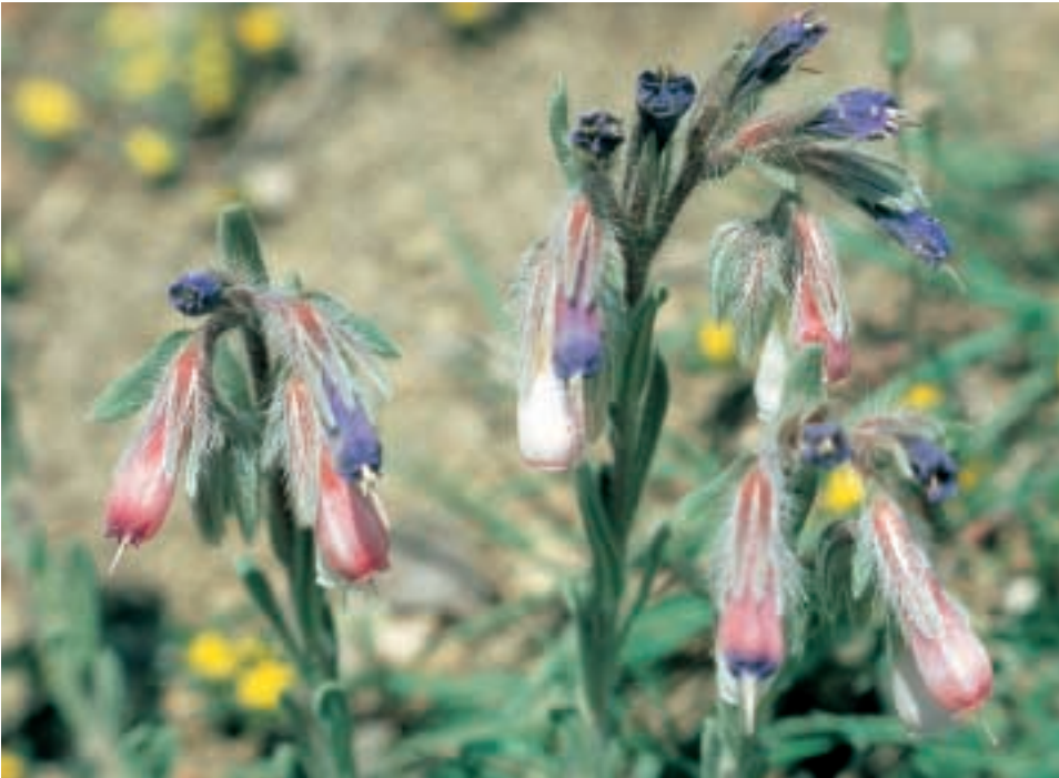
Abb. 11: Onosma pulchrum H. Riedl