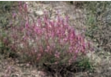
Polygala anatolica Boiss. & Heldr. in Boiss.