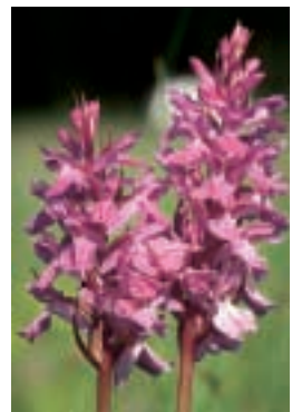
Dactylorhiza osmanica (Kl.) Soo