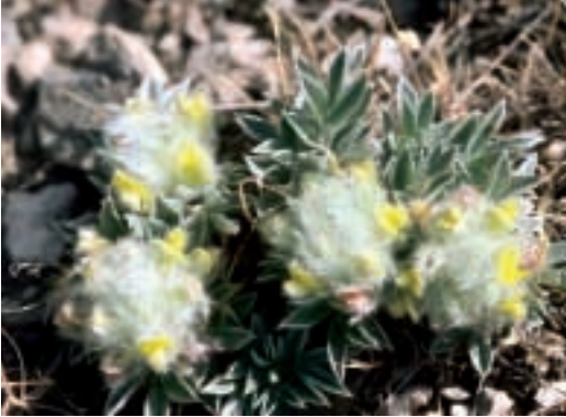
Abb. 5: Astragalus aydosensis Peşmen & Erik