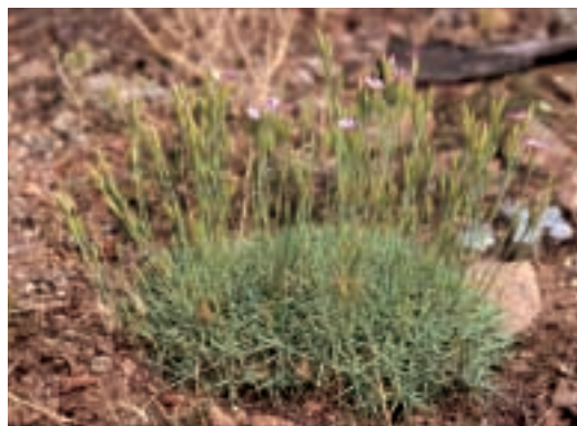
Abb. 2: Dianthus erinaceus Boiss. var. erinaceus