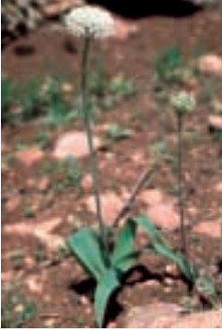
Allium gayi Boiss.