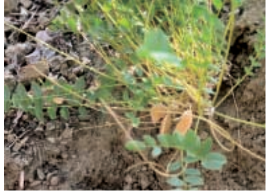
Abb. 8: Astragalus hakkiaricus Chamb. & Matthew