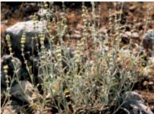
Abb. 9: Sideritis huber-morathii Greuter & Burdet