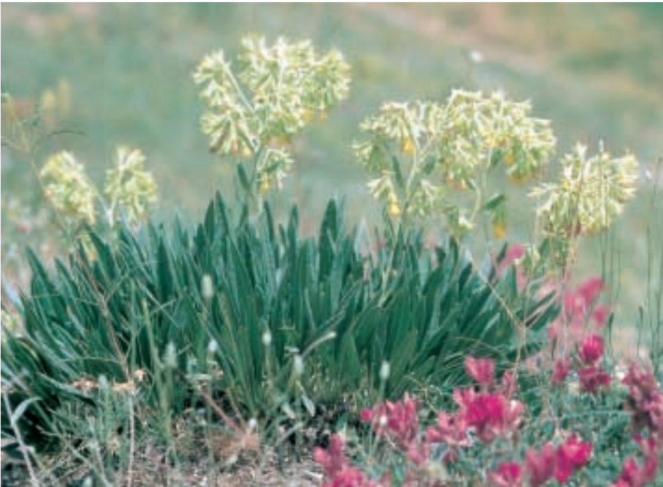
Abb. 12: Onosma sintenisii Hausskn. ex Bornm.