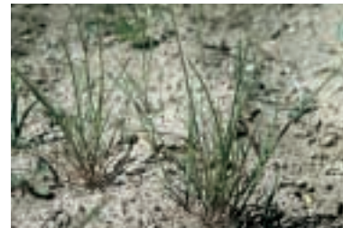
Parapholis incurva (L.) C. E. Hubbard