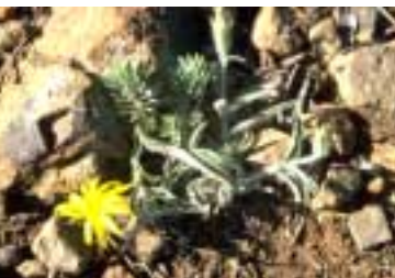
Scorzonera pisidica Hub.-Mor.