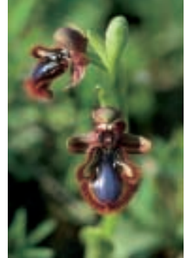
Ophrys vernixia Brot. ssp. vernixia