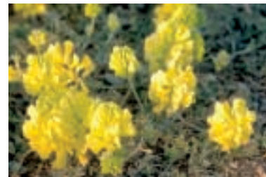
Hedysarum nitidum Willd.