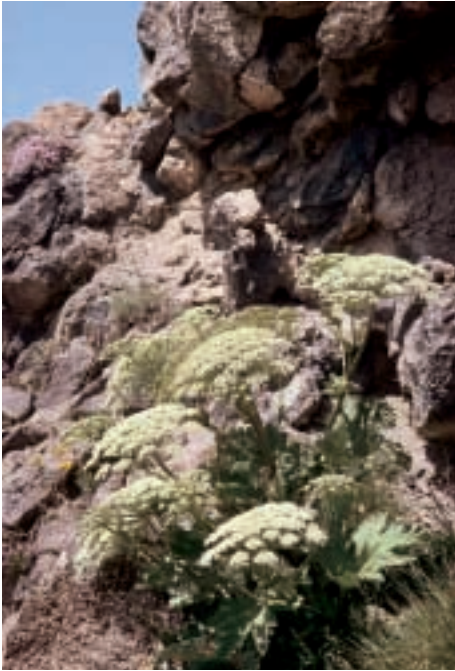
Abb. 13: Heracleum antasiaticum Manden.