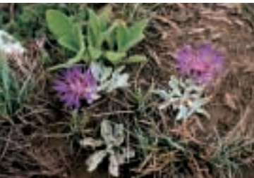
Centaurea pichleri Boiss. ssp. pichleri