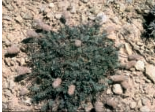
Abb. 6: Astragalus sparsipilis Hub.-Mor. & Chamb.