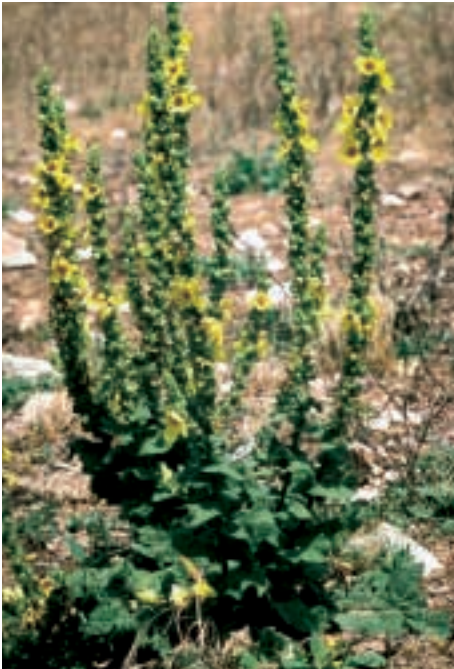
Abb. 23: Verbascum amanum Boiss. × caesareum Boiss.