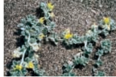
Medicago marina L.