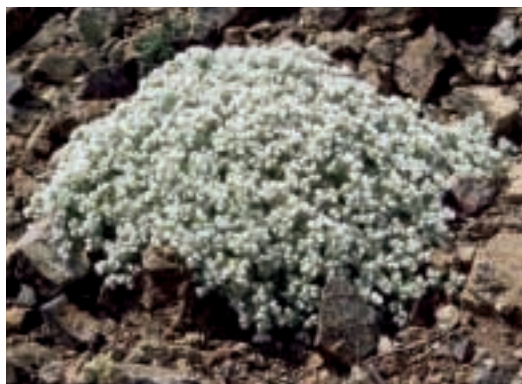
Abb. 1: Paronychia arabica (L.) DC. ssp. euphratica Chaudhri

Davis 10/191, Hub.-Mor. in Bauh. 6/3: 371, 1. Fund Ekim 16. 6. 1976, Bauh. 14/2000: 105, 2. Fund Ny. 11568 3. 8. 1976, seither weitere 13 Funde. Anatolischer Endemit in B3 Eskişehir, neu in A2(A) Bursa, B2 Bursa und B3 Kütahya.