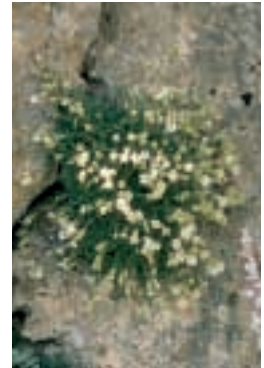
Silene odontopetala Fenzl