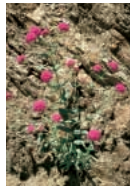
Silene compacta Fischer