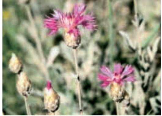
Abb. 18: Centaurea huber-morathii Wagenitz