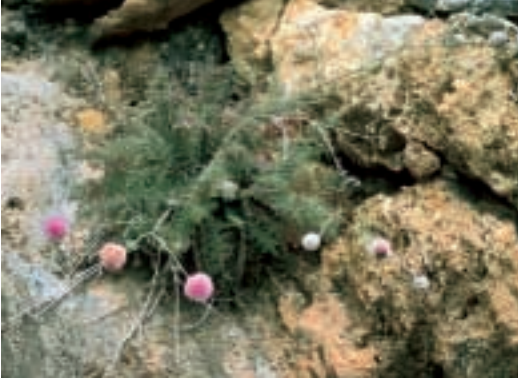
Abb. 17: Centaurea scopulorum Boiss. & Held. var. gracilior Wagenitz