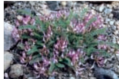
Astragalus schizopterus Boiss.