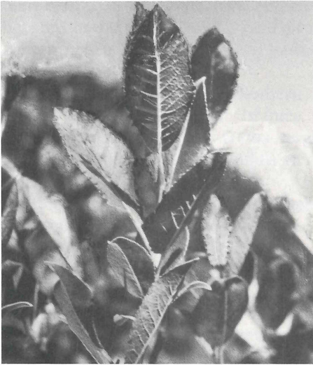
Abb. 2. Salix mielichhoferi .