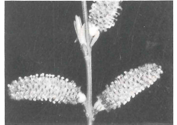
ssp. angustior , Lötschental, Kühmad, 1610 m ü. M.