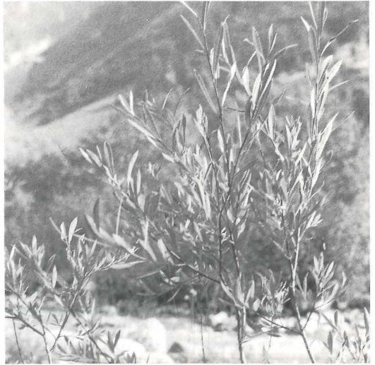
Strauch im Lötschental (VS), Kühmad an der Lonza, 1610 m ü. M. – 5.10.1978.