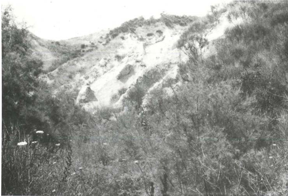
Abb. 4. Calanco bei Castrocaro. Im Vordergrund Tamarisken, rechts oben sowie auf dem Hügel Spartium -Gebüsch. In der Bildmitte fast vegetationsfreie Partien und Rasen.

Böden an pflanzenverfügbarem Wasser insbesondere im niederschlagsarmen Sommer äusserst gering ist, herrschen zeitweise extreme Ariditätsverhältnisse. Die Salzkonzentration der Bodenlösung erreicht Werte, bei denen empfindliche Pflanzen geschädigt werden können.